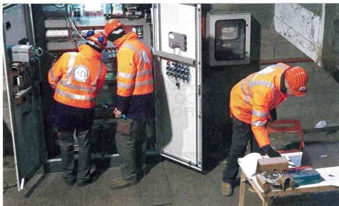
Operatori mit.D. group in azione