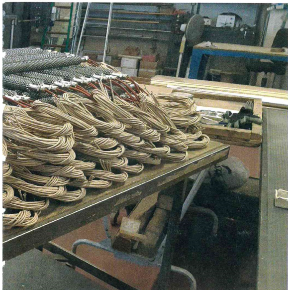
Parti di resistenze in fase di assemblaggio